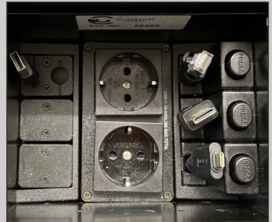
LAN-, HDMI-, USB-C-Kabel